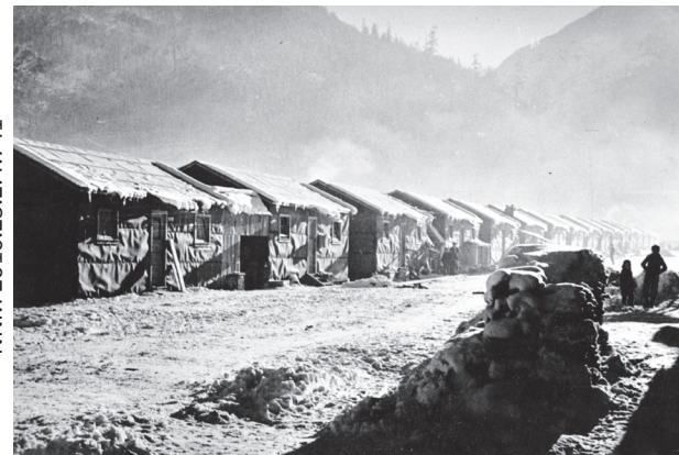
強制収容所のタシュミ、1943年

容させられました。18歳から45歳の男性は家族と隔離され土木工事などに従事し、これに抵抗する人はもっと過酷な戦争捕虜収容所に送られました。離れ離れになりたくない家族は、草原地域のでんさい畑で長時間、無休の悪条件で働くか、もしくは他の州に移動を強いられたのです。