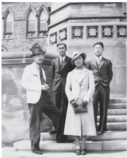
1936年、日系カナダ人は選挙権獲得のために陳情を行った

19世紀末期から20世紀初頭、日系人は漁業、鉱業、林業、農業に従事していました。日系コミュニティはバンクーバー市東部のパウエル・ストリートを中心に栄え、日系人はブリティッシュ・コロンビア西海岸やバンクーバー・アイランド各地で暮らして