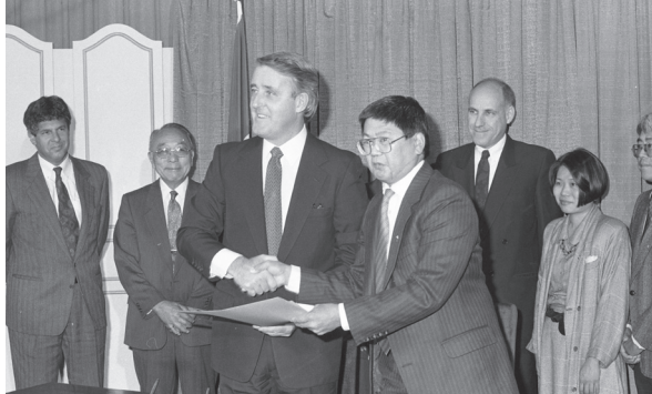
1988年、補償に関する同意後の首相のブライアン・マルルーニーとNAJCAの代表のアート・ミキ

1988年9月22日、カナダ政府は全カナダ日系人協会との間で同意書を取り交し、政府は正式に1940年代の日系カナダ人の扱いは不法な措置と認識し、保証金として